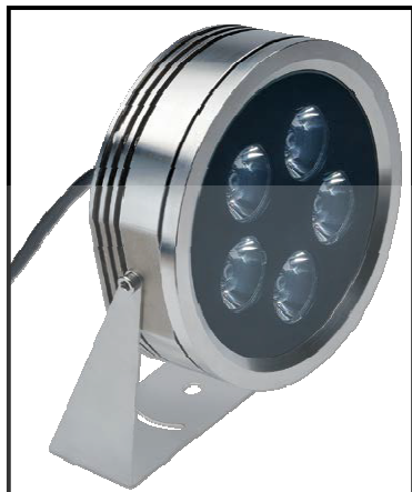
HYDROSCUBA MEDIUM COD. 301005